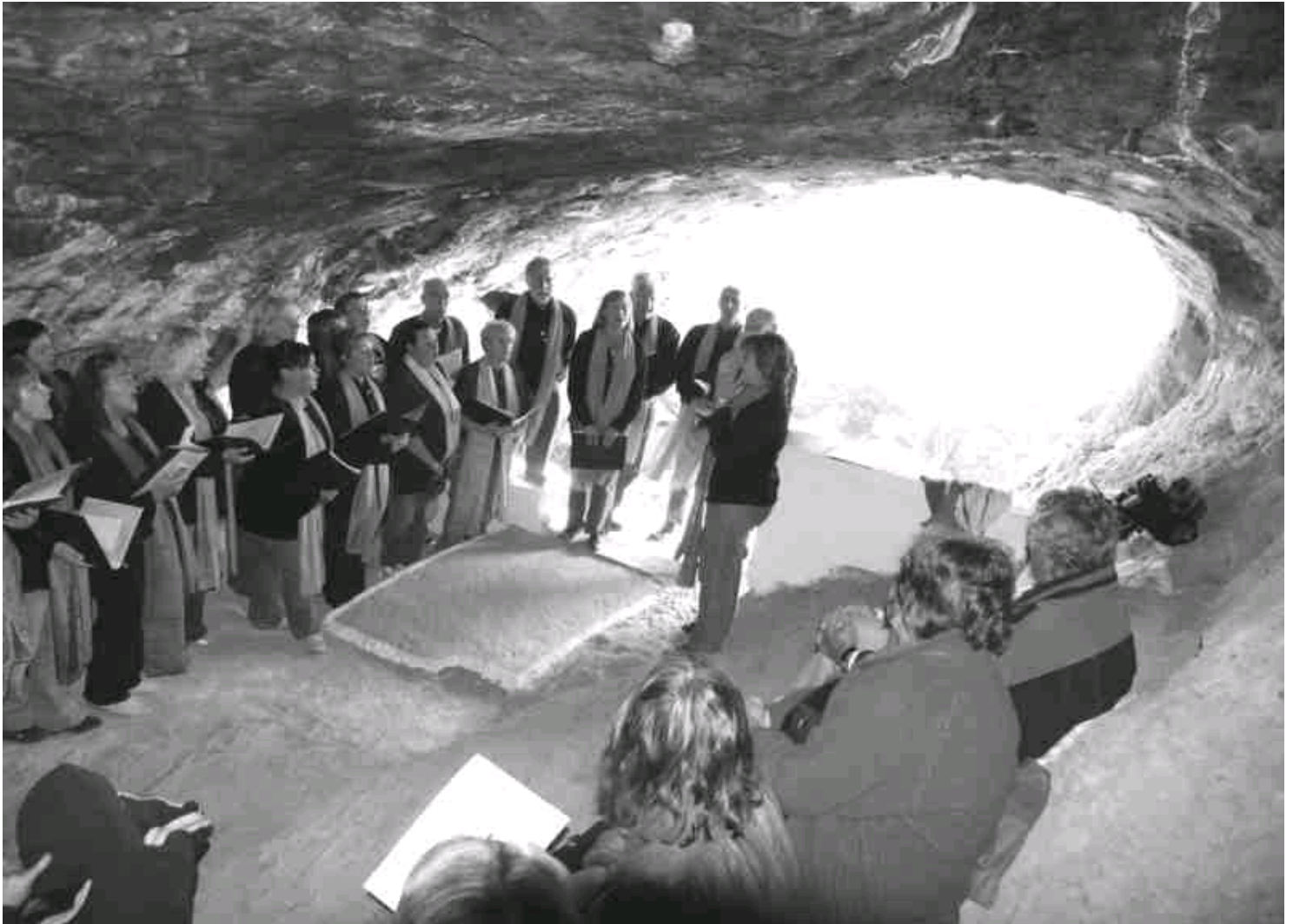
Der Rainbow-Chor 2006 in der Grotte von Milatos

Im April werden wir gleich drei Chöre zu Gast haben. Den Auftakt macht der Intercanto-Chor am Karfreitag. Das εγκώμιο aus der orthodoxen Karfreitagsliturgie wird in Heraklion erklingen. Für viele ist es das schönste aus der gesamten orthodoxen Liturgie.